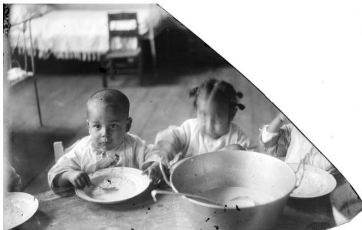
Fig. 7: Huérfanos comiendo en una habitación de un orfanatorio.