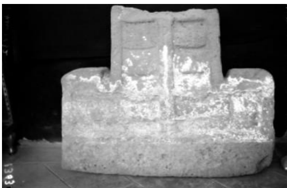
Fig. 4: Suisa Vela, retrato.