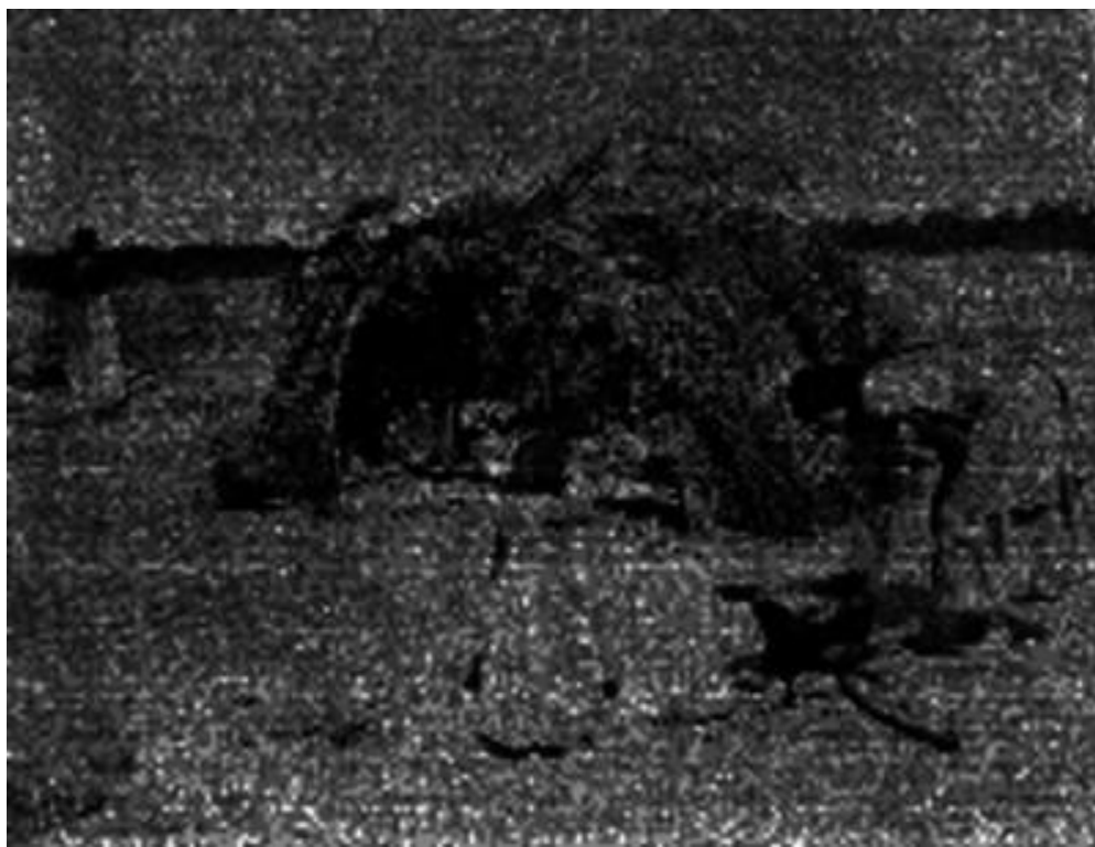
Fig. 1: Opatas haciendo labores frente a su choza.

Opatas haciendo labores frente a su choza (fotografía 1, cuadro 1) es una imagen carente; apenas se descubre una supuesta línea de horizonte; un cúmulo más oscuro al centro que podríamos identificar con la choza y hacia el frente, unas líneas difusas que podrían ser los cuerpos de los optas. Apenas alcanzamos a adivinar la imagen. Visible pero ilegible. Si tenemos herramientas de cómo poder apreciar la imagen, es por la ficha que aparece junto a ella. Sin embargo, dicha información podría relatar una narración falsa, contener errores en el lugar de origen y temática y arrojarnos a otra latitud y no necesariamente al pueblo Opata en Sonora.