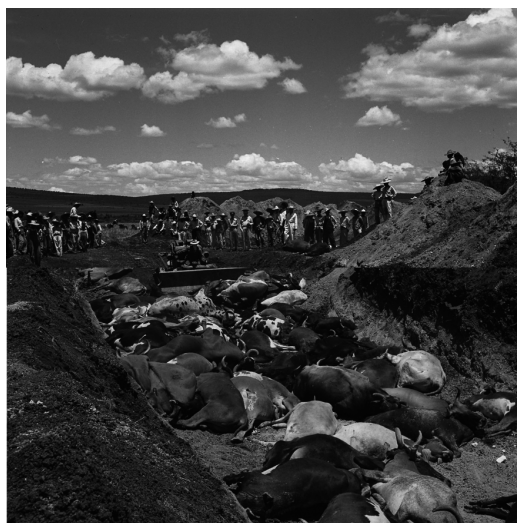
Fotografía 2, Campaña fiebre aftosa.