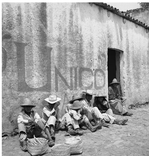
Fotografía 1, Campesinos en barda.

van desde «Elefantiasis» hasta «Trajineras en Xochimilco» e imágenes que se vinculan con el ámbito rural. En un segundo intento de clasificación, personal del MNA, catalogó los negativos en orden alfabético en un listado que va desde «abejas» hasta «zopilote». Una tercera clasificación tiene que ver con una propuesta de exposición (que se desconoce si se llevó a cabo) en el mismo MNA, para cuyo guión museográfico se crearon los siguientes apartados temático-conceptuales: Tequila, Jalisco; La campaña de la fiebre aftosa; contrastes; tejedores de pueblos; surcos; maderera del Trópico; pesca en el lago de Texcoco; magia del fuego; fotografía en color; y Los de abajo (fotografías 2, 3, 4 y 5).