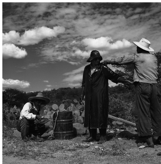
Fotografía 7. Campaña contra la fiebre aftosa.