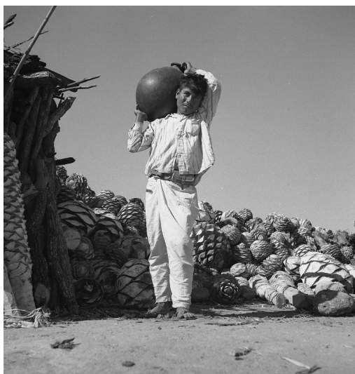
Fotografía 6. Producción de mezcal.

información que causa que las fotografías se queden en un nivel meramente ilustrativo, pues el contexto histórico-social es inexistente. A partir del mencionado proyecto de posgrado en Diseño y Comunicación Visual se propuso publicar una colección editorial bajo el enfoque una primera publicación en la serie fotográfica del combate a la Fiebre Aftosa (Torres, 1956), al considerar que la importancia de esta epizootia (fotografía 7), en el contexto político y social de los años cuarenta que podría dar cuenta de la importancia del archivo con respecto al estudio de la imagen y de una problemática rural presente en la época denominada el Milagro mexicano (Torres, 2010).