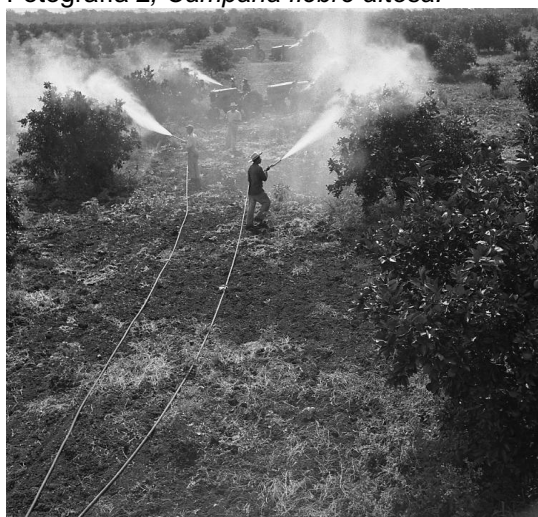
Fotografía 4, Fumigación.